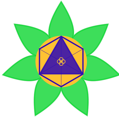
Figura 2: Flor de la Esencia