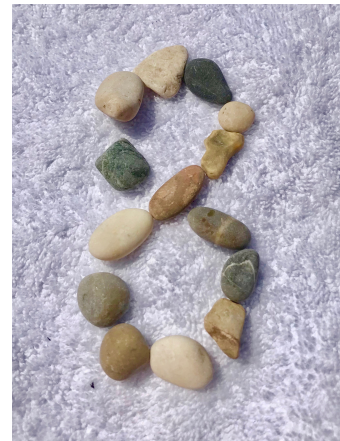
Figura 36: Símbolo de infinito vertical