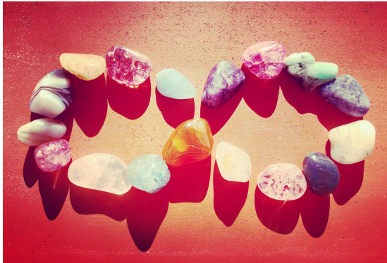
Figura 35: Símbolo de infinito horizontal