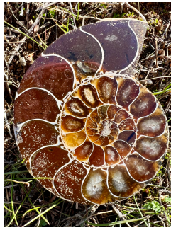
Figura 4: Fósil de concha de nautilus

¿Sabías que todo el universo está construido sobre geometría sagrada: ¿la naturaleza, el cosmos y también el cuerpo humano? Tú y yo nos basamos en la geometría sagrada. Todo está compuesto de geometría en diversas formas, figuras, colores, secuencias y direcciones.