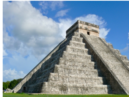
Figura 20: Las Pirámides de Guiza en Egipto Figura 21: Pirámide “El Castillo” en Chichén Itzá/México durante el equinoccio