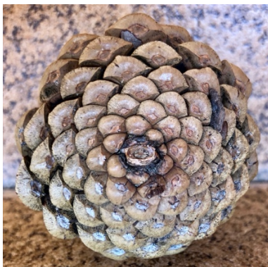
Figura 6: Piña